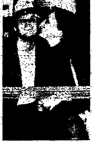
السلم بول نينانين بعد استلامه للبوليس في مدينة تورنتو...